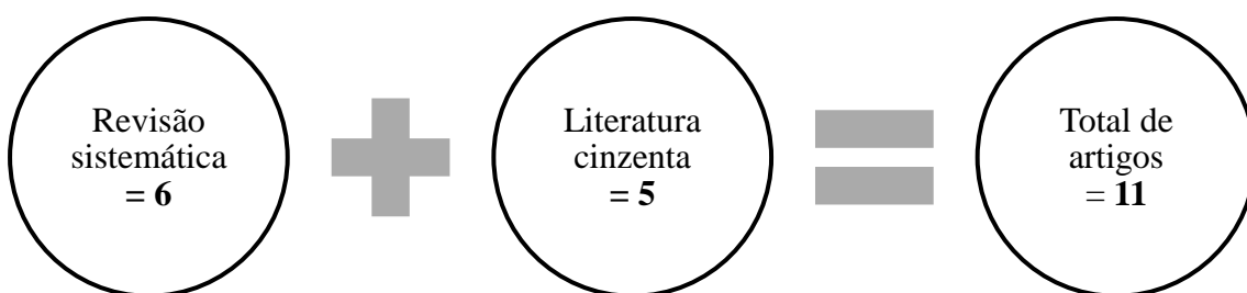
Figura 1. Esquema de documentos selecionados para análise final

No sentido de uma melhor organização, a figura 2 apresenta o fluxograma, que clarifica o procedimento realizados para admissão dos documentos para análise final, referente a revisão sistemática da literatura.