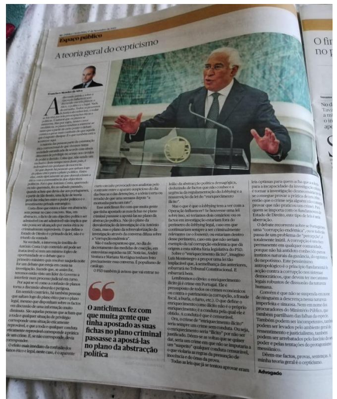
Figura 6 - Outros Posicionamentos Gráficos Presentes nas Edições do Jornal "Público" no ano 2023.

Tal como acontecia em 1993, nas edições mais atuais do jornal "Público", nem sempre a disposição dos textos é uniforme.