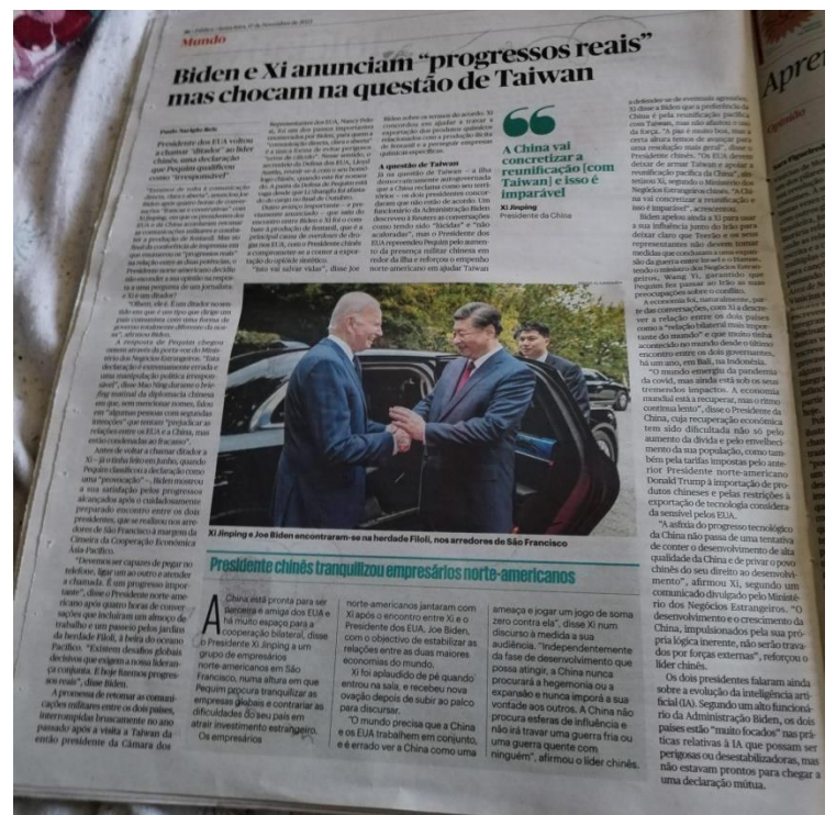
Figura 5 - Alinhamento Gráfico Mais Comum nas Edições do Jornal "Público" de 2023.

O alinhamento gráfico da informação nas edições do Jornal "Público" de 2023, é algo diferente daquele presente nas edições de 1993.