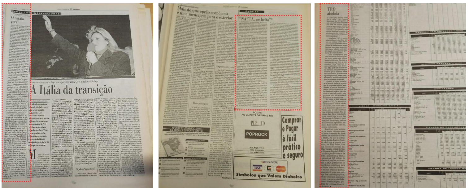
Figura 8 - Exemplo do Posicionamento Equilibrado, Negativo e Positivo, de 1993, respetivamente.

10 de 38 peças contêm abordagens equilibradas por parte dos autores (26.31%) e apenas 6 contêm posicionamentos ou interpretações positivas por parte dos seus respetivos autores (15.79%).