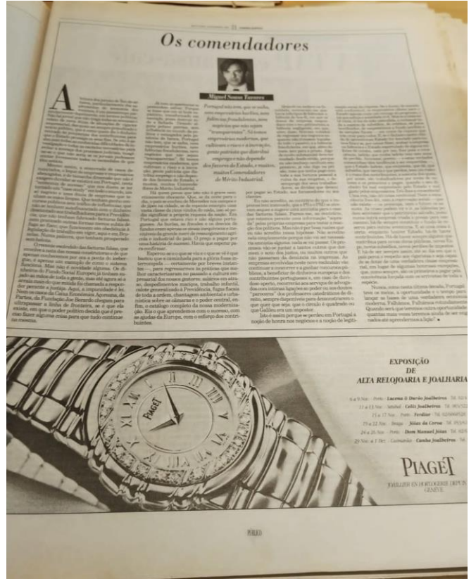
Figura 3 - Outros Posicionamentos Gráficos Presentes nas Edições do Jornal "Público" no ano 1993.

Apesar da disposição textual referida em cima ser a "base" da forma como o texto era posicionado nesta época, existem algumas exceções à regra.