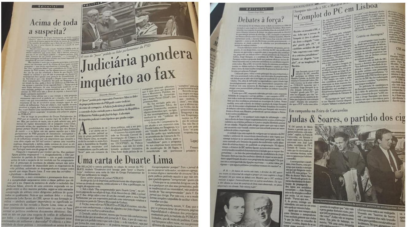
Figura 4 - Outros Posicionamentos Gráficos Presentes nas Edições do Jornal "Público" no ano 1993.

Apesar da disposição textual referida em cima ser a "base" da forma como o texto era posicionado nesta época, existem algumas exceções à regra.