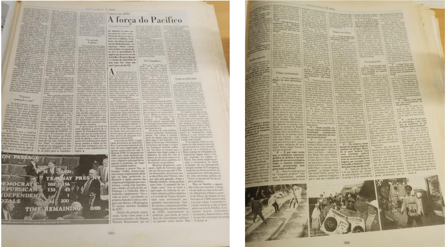
Figura 2 - Alinhamento Gráfico Mais Comum nas Edições do Jornal "Público" de 1993.

Observando a disposição gráfica das edições do Jornal "Público" de Novembro de 1993, podemos observar que o texto é distribuído por seis diferentes colunas de informação e acompanhado de imagens, na sua grande maioria a preto e branco.