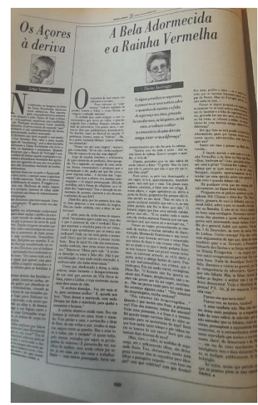
Figura 7 - Outros Posicionamentos Gráficos Presentes nas Edições do Jornal "Público" no ano 2023.