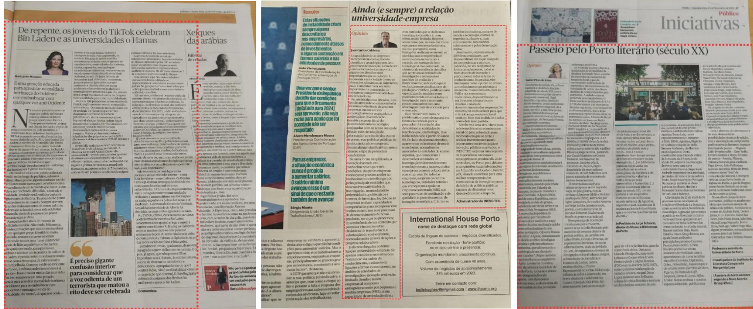
Figure 10 - Exemplo do Posicionamento Equilibrado, Negativo e Positivo, de 1993, respetivamente.

Curiosamente, pelo mesmo número de ocasiões, quem escreveu uma peça nesta amostra teve uma abordagem equilibrada ou positiva de um determinado tema (14 de 57 vezes, 24.56%).