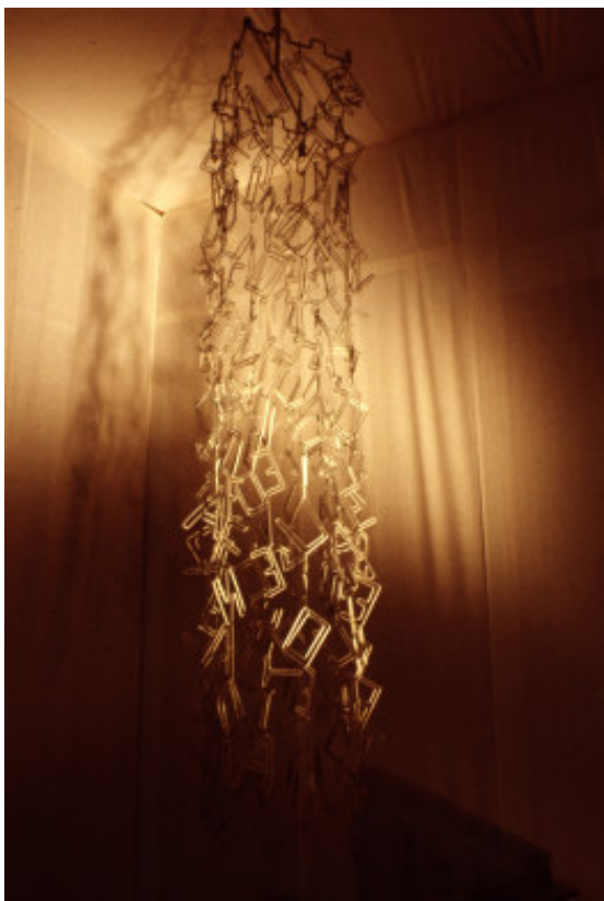
Fig. 9: Maquinin . 1963, mobile em alumínio anodizado.

Outros versos dos seus poemas houve que também foram transpostos para a escultura em arame ou ferro cromado. O “Maquinin”, por exemplo, partindo do texto “Eu visto o que vesti ao manequim / sou poeta que mente o que se sente / e só fico contente quando visto / aquilo que se ri atrás de mim”, 40 acaba sendo uma metáfora do processo criativo da poeta: a máquina-manequim é a estrutura variável pronta a receber na sua forma as mais variadas roupa(gen)s. E, em (mais um) diálogo intertextual com Fernando Pessoa, 41 Salette Tavares usa o manequim – que também é “máquina” no jogo verbal que o título introduz – como motivo para o seu próprio refazer-se, vestir-se, transformar-se.