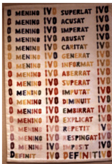
Fig. 7: Tapeçaria do Menino Ivo. 1979. 80 x 120 cm. In: Obra Poética, p. 503.