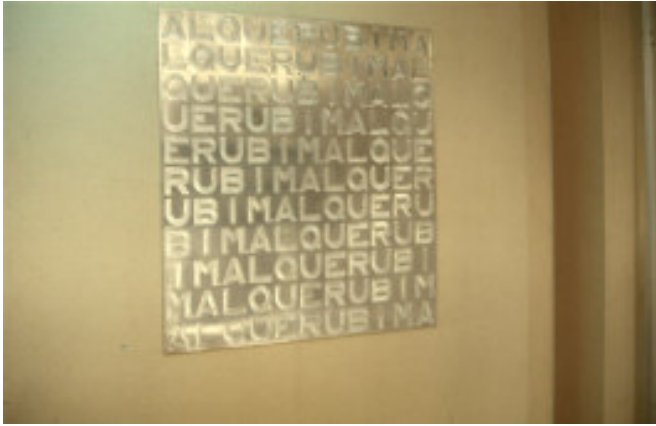
Fig. 10: Alquerubim . 1979, alumínio polido, 70 x 70 cm [aprox.]. Desparecido; imagem cedida por S.B.

Este tipo de trabalhos, em que se fundem as artes gráficas, a escultura e a literatura, foram realizados e apresentados para esta retrospectiva integrando um conjunto no qual se assinalava o “objecto encontrado” como parte da sua produção poética. Para isso, Tavares enquadrou todos os seus “objectos espaciais” (como lhes chamava no catálogo da exposição 43 ) sob o título genérico de “Brincar”. Esta poesia espacial está associada ao “brincar” uma vez que brincar exprime a relação criativa da criança com o mundo que aprende. “Brincar”, diz Salette Tavares no texto da sua exposição retrospectiva, “é um estado natural e permanente tal qual o foi na escola e em casa” (s.p.). Não há espaços vazios no crescimento de uma criança: tudo é novo. Na ausência de estímulo, na ausência de objectos-brinquedo, outras coisas os substituem, mas sempre o lugar do objecto (a sua necessidade) é mantida. É por isso que Salette Tavares fala da presença do objecto na própria linguagem: “Bastava a palavra que se coisificava. Era tão fácil jogar com ela como jogar à bola”. Os trabalhos em exposição são o resultado, também, e por isso, de “Dialogos criativos” entre Salette Tavares e os seus três filhos.