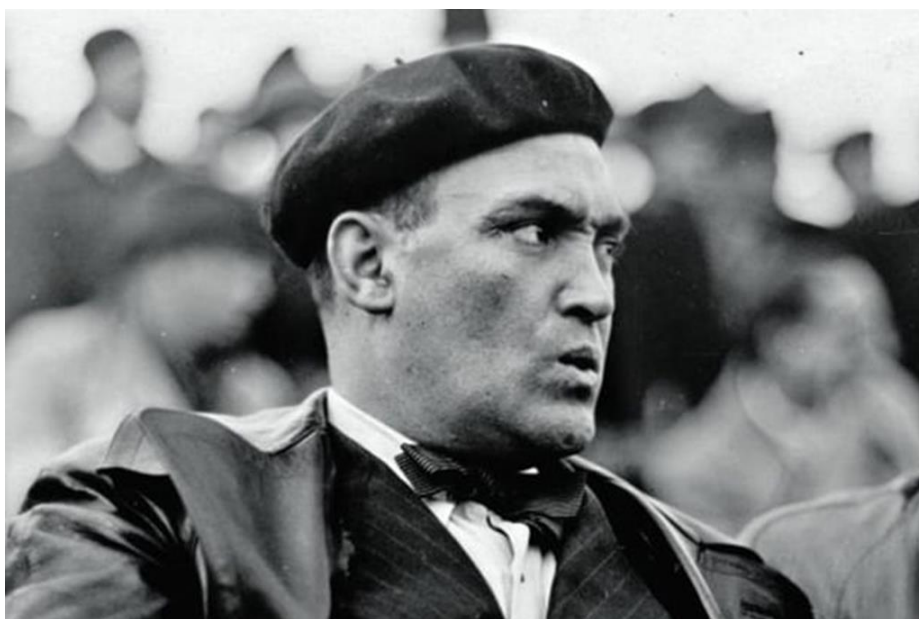
Figura 1 - Cândido de Oliveira, ex-treinador e jogador de futebol e fundador do jornal A Bola ( https://rr.pt/bola-branca/noticia/futebol-nacional/2024/05/09/um-treinador-de-futebol-que-foi-um-espiao-contra-os-nazis-candido-de-oliveira-tinha-um-idealismo-enorme/377640/ )

O lançamento do periódico A Bola em 1945, criado por Cândido de Oliveira, marcou o nascimento da imprensa desportiva especializada nacional, tornando-se até hoje, um dos jornais mais influentes e simbólicos do desporto em Portugal (“A Bola trouxe uma nova linguagem e um novo olhar para o desporto, valorizando a crónica, a análise e a cultura desportiva” (Silva, 2017, p. 88). Outros exemplares como o Record, em 1979, e O Jogo, em 1985 juntaram-se mais tarde como concorrência, o que intensificou o processo de cobertura e de redação, descentralizando o discurso desportivo na imprensa nacional. A existência de concorrência na imprensa levou a que os jornais passassem a montar uma equipa de colunistas fixos, de correspondentes em outros países e ainda de colaboradores que ajudavam na cobertura de outras modalidades desportivas.