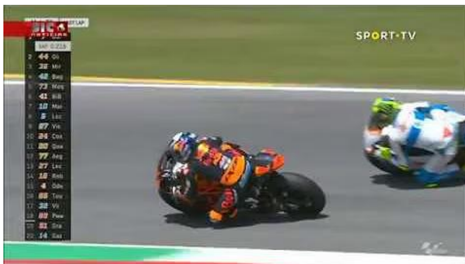
Figura 5 - Miguel Olveira a vencer o GP de Itália de 2018 de Moto2 com o relato de Guto Nejaim de fundo ( https://www.youtube.com/watch?v=cG3rD7_b-ms )

Com isso, podemos concluir que “na rádio, o narrador constrói a realidade; na televisão, apenas a acompanha e interpreta” (Silva, 2010).