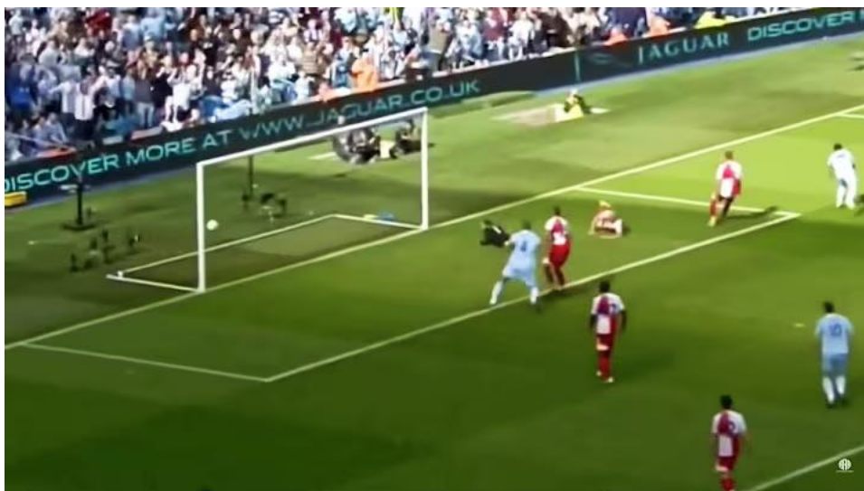
Figura 9 - Narração de Martin Tyler ao golo decisivo do Manchester City, vencendo o título da época 2011/12 nos minutos finais ( https://www.youtube.com/watch?v=2tRPedhVKgQ )

Será que se Martin Tyler tivesse narrado o golo decisivo do título do Manchester City, na última jornada do campeonato sem a emoção que aplicou na época 2011/2012, este golo seria tão histórico e nostálgico como é nos dias atuais?