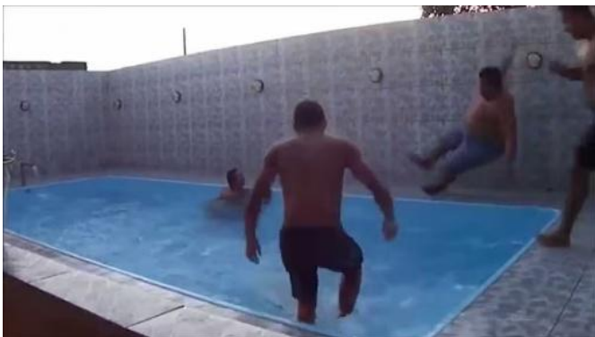
Figura 11 - Exemplo de uso abstrato do relato de Galvão Bueno, criando um meme cómico ( https://www.youtube.com/watch?v=F8XdStP2a9Q )