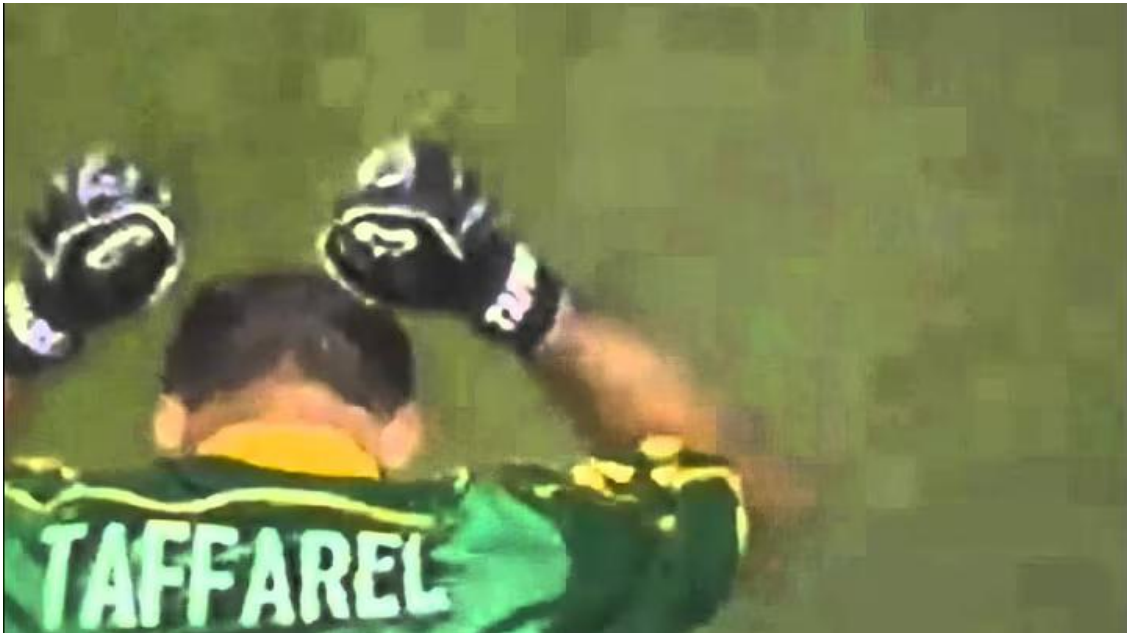
Figura 10 - Relato de Galvão Bueno à defesa icónica de Taffarel nas grandes penalidades, eternizando o "Sai que é sua, Taffarel" ( https://www.youtube.com/watch?v=2tRPedhVKgQ )

criar momentos históricos, não pela jogada em si, mas pelo relato tão bom e emocionante que torna-se um facilmente reconhecíveis pelo adeptos, como por exemplo aconteceu na narração de Galvão Bueno e o seu “Sai que é sua, Taffarel” mencionado anteriormente, saindo o jogador igualmente imortalizado pelo momento e impacto do relato.