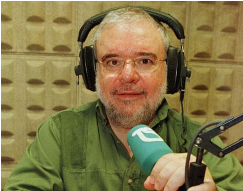
Figura 6 - Jorge Perestrelo, ex-narrador da TSF, conhecido pelo seu carisma ( https://wikidobragens.fandom.com/pt/wiki/Jorge_Perestrelo )

Dentro de algumas outras figuras que se destacaram como ícones do relato, temos por exemplo, Jorge Perestrelo, figura de expressividade inconfundível, Nuno Matos, figura icónica da Antena 1 e mais atualmente, António Botelho, atual narrador da DAZN e da TSF que traz muita emoção nos seus relatos.