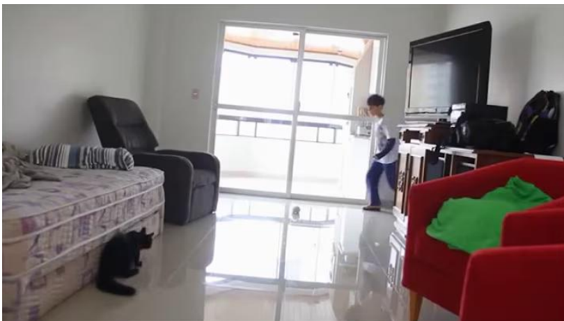
Figura 12 - Exemplo de uso literal do relato de Galvão Bueno, através das "defesas" de um gato ( https://www.youtube.com/watch?v=S7LN_54uHwM )

A televisão também permite um carácter emotivo, embora menor que a rádio, sendo o relato televisivo mais como uma forma de guiar o telespectador pelo acontecimento que aparecem no ecrã, como mencionado anteriormente.