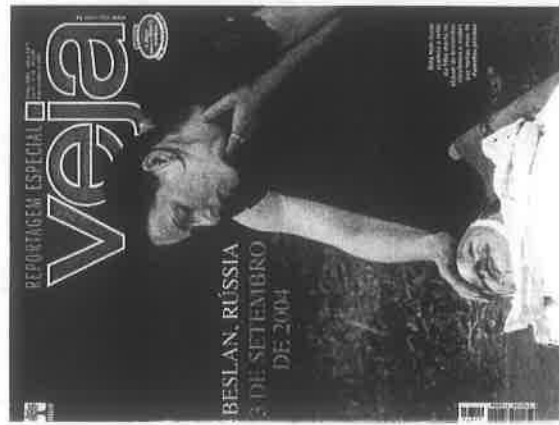
Veja (8 de setembro)

Foram analisadas as primeiras edições das revistas brasileiras Veja (8 de setembro), IstoÉ (8 de setembro) e Época (6 de setembro) e das revistas portuguesas Visão (9 de setembro), Focus (8 de setembro) e Sábado (10 de setembro) publicadas logo após o atentado.