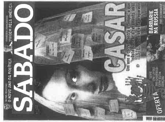
Sábado (10 de setembro)