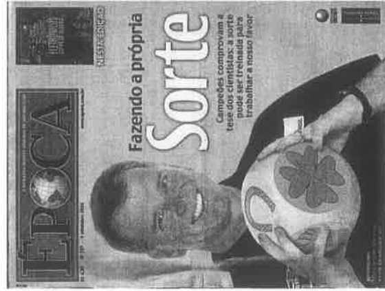
Época (6 de setembro)