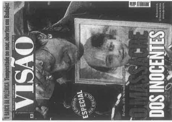
Visão (9 de setembro)