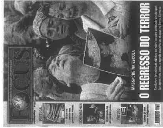
Focus (8 de setembro)