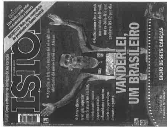
IstoÉ (8 de setembro)