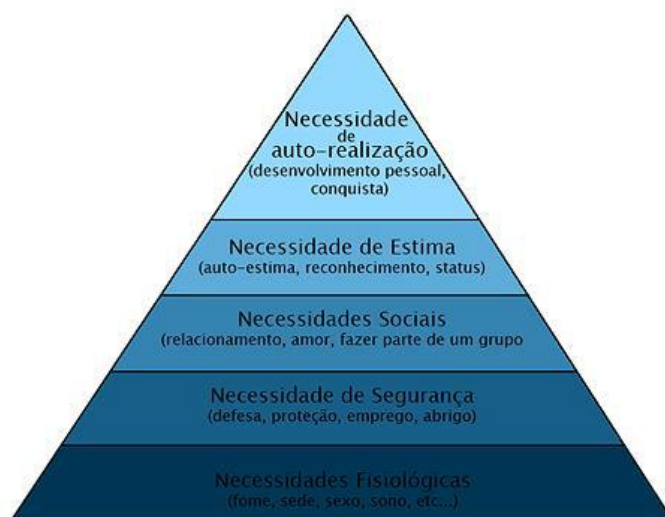
Figura. 1 - Pirâmide das Necessidades Humanas segundo Maslow (Paiva, 2013, p.9)

Maslow (1969) elaborou uma hierarquia crescente onde colocou as necessidades básicas do ser humano. Segundo ele, as necessidades são extremamente primitivas, básicas e exigentes. Por serem fundamentais, elas compõem a base da pirâmide: são as necessidades fisiológicas. No próximo nível da pirâmide estão necessidades de segurança íntima (física e psíquica), que são consideradas como menos exigentes pois precisam de ser saciadas menos frequentemente e permanecem satisfeitas por períodos relativamente longos. Em seguida, no próximo nível da pirâmide, as necessidades passam a tornar-se mais sociais: são as necessidades de amor e relacionamentos. Mais acima estão as necessidades de estima (autoconfiança), que incluem o desejo de ser bom em alguma atividade, de ter uma certa forma de poder, e de ser apreciado. Por fim, no cume da pirâmide, encontram-se as necessidades de autorrealização - ou seja a necessidade de desenvolver as próprias potencialidades (Simões, 2010; Alves, 2011).