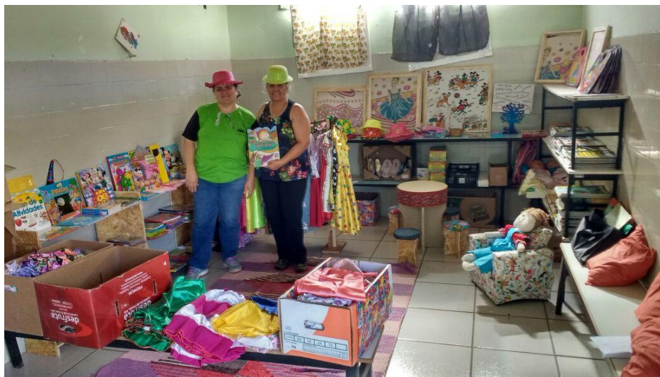
Figura 4: Visita da coordenadora à sala de leitura.

bilhetes que explicavam a procedência do material que as crianças levariam para casa e a finalidade do mesmo.