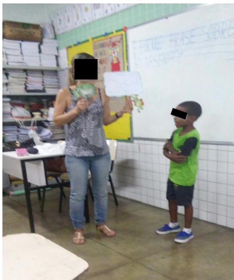
Figura 1: Atividade de reconto literário.