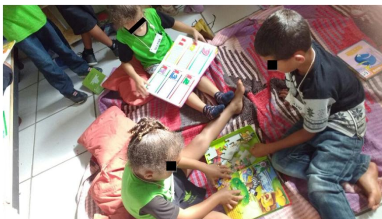
Figura 5: Crianças lendo os livros escolhidos.

Dessa forma, permitiu-se que escolhessem um livro e com a ajuda da professora realizou-se o controle dos livros emprestados em um caderno, de modo a colocar o número do livro na frente do nome de cada aluno. Alguns alunos permaneciam sentados desfrutando dos livros escolhidos (Figura 5). Todos agradeceram ao final da aula e se comprometeram entregar os livros na aula seguinte.