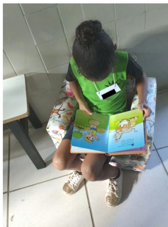
Figura 8: Criança lendo na sala na hora do intervalo.