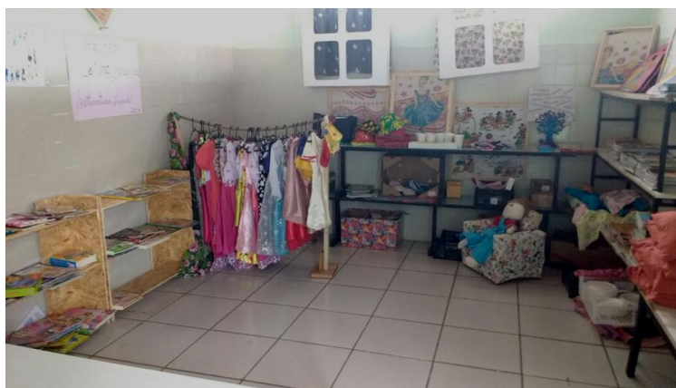
Figura 3: Sala da Leitura Prazerosa.

A bancada foi higienizada e foi colocado um suporte de filtro com galão de água mineral, com copos descartáveis para uso de todos.