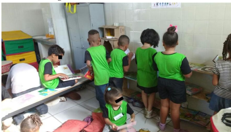
Figura 6: Alunos escolhendo livros

Não houve dificuldade na dramatização da história, devido à participação da professora. Foi percebido também que existem crianças, como no caso da menina intérprete do “Chapeuzinho Vermelho”, que não possuem muita noção de história. A turma no geral foi muito interessada, tiveram um bom comportamento e interesse em compartilhar os livros durante a disponibilização dos mesmos.