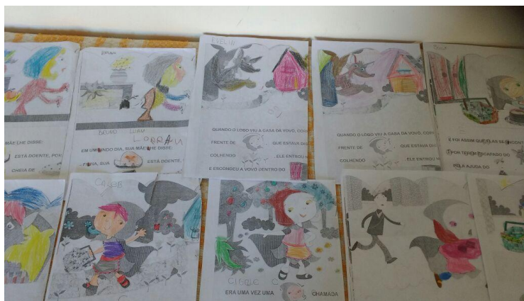
Figura 7: Atividade de colorir.

Percebeu-se através dessa atividade que há crianças que não conseguem distinguir bem as cores, uma vez que alguns usaram o lápis marrom para colorir a capa de Chapeuzinho Vermelho, já outros usaram o lápis verde para colorir o rosto de Chapeuzinho e da vovó (Figura 7).