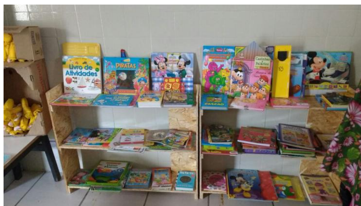
Figura 2: Estantes (material: compensado).