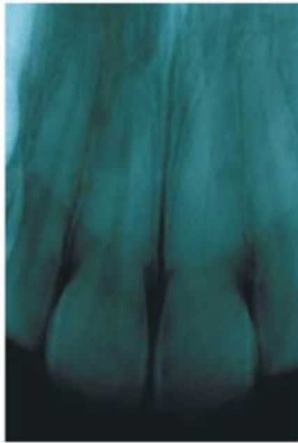
Figura 3: Radiografia periapical de um incisivo central superior esquerdo com calcificação total do canal radicular. (Silva e Muniz, 2007)

Nas radiografias convencionais, consegue-se detetar nódulos pulpaes na câmara, ao contrário das calcificações na raiz que usualmente só são detetadas durante a exploração do canal radicular. (Cohen e Hargreaves, 2011)