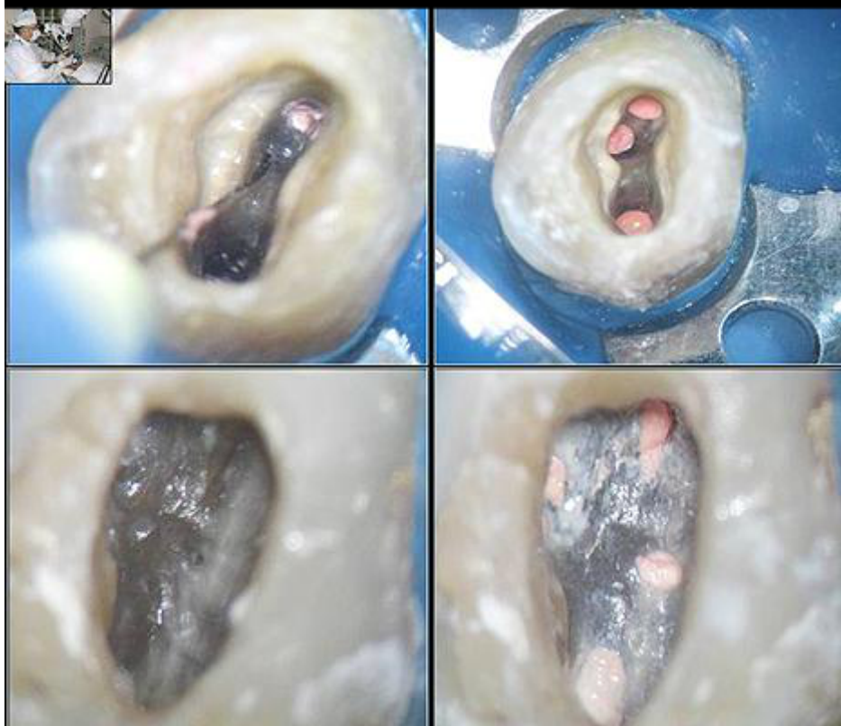
Figura 5: Localização, instrumentação e obturação de canais calcificados.