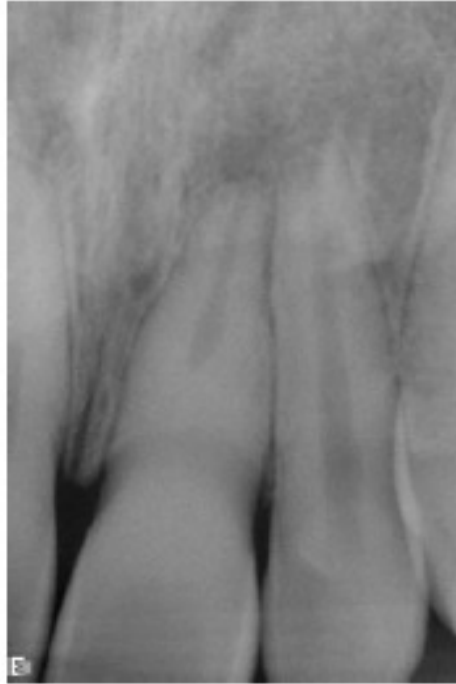
Figura 2: Radiografia periapical de um incisivo central superior esquerdo com calcificação parcial canalar e lesão apical. (McCabe e Dummer, 2012)

O seu diagnóstico de calcificação canalar é precoce, quando o dente apresenta obstrução total do espaço pulpar coronário e/ou radicular, sem quaisquer vestígios das paredes laterais nos exames radiográficos obtidos. (Munley, 2005)