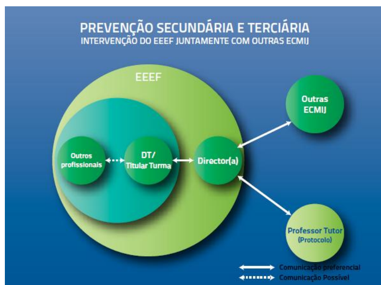
Figura 2 - Prevenção Secundária e Terciária: Articulação do EEEF com outras ECMIJ ao nível da intervenção de 1ª linha (Adaptado de Caplan, cit in Montano et al., 2011, p.111).

No que respeita à Prevenção Terciária considera-se duas situações distintas no que diz respeito à articulação entre os profissionais dos EEEF com as CPCJ e entre eles e os tribunais (Montano et al., 2011).