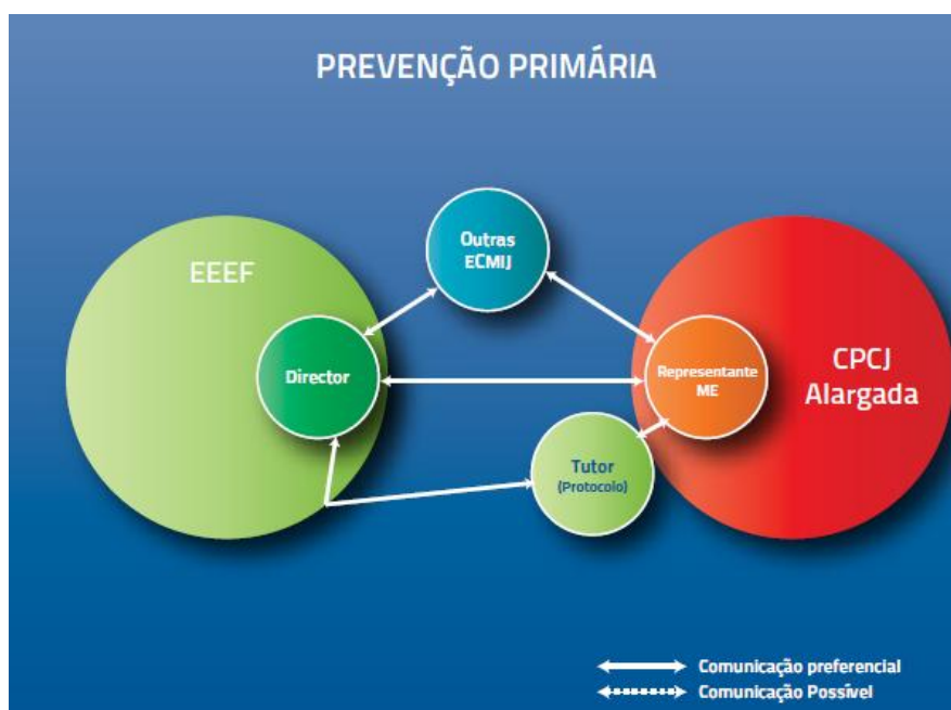
Figura 1 – Prevenção primária: Articulação entre as EEEF, outras ECMI e a CPCJ (Adaptado de Caplan, cit in Montano et al., 2011, p.110).

Ao nível da prevenção secundária e terciária , devem ser consideradas tanto as situações intervencionadas pelos EEEF com ou sem a colaboração de outras entidades com competência em matéria de infância e juventude (ECMIJ), as que são sinalizadas para as CPCJ, assim como as que são objeto da intervenção dos tribunais (Montano et al., 2011).