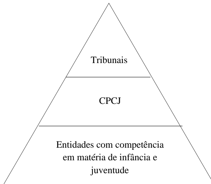
Figura 2: Níveis de Intervenção

necessário que a criança ou jovem seja retirada (Associação Promotora da Educação Social).