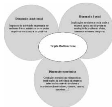
Fig.1 As três dimensões do RSE (Biorumo, 2005).

A sociedade não se comportando de forma sustentável, compromete a capacidade das gerações futuras satisfazerem as suas próprias necessidades, à custa das necessidades das actuais gerações (Raven e Berg, 2004). A competitividade a longo prazo numa empresa tem de ser alcançada tendo em conta que esta aparente incompatibilidade terá de ser superada, e o desenvolvimento sustentável reconhecido e incentivado. Conjugado de forma equilibrada, as componentes ambiental, social e económica do desenvolvimento, constitui um desafio a alcançar.