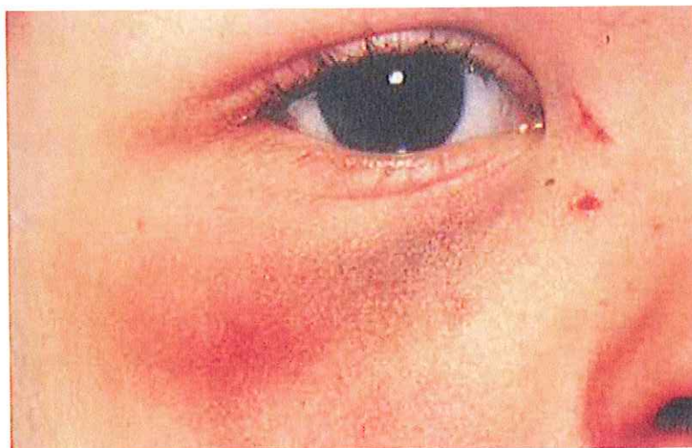
Figura 4 – Lacerações e hematomas com estados de evolução distintos. As lesões pretas azuladas são mais recentes e as lesões castanhas amareladas são mais antigas (Color Atlas of Oral Diseases in children and adolescents, 1994)