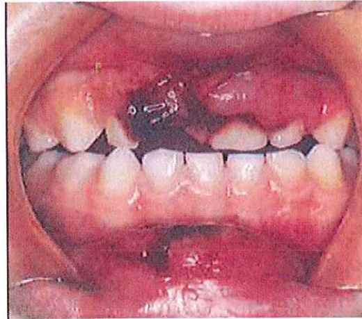
Figura 3 – Lesão provocada por violência doméstica nos dentes decíduos superiores, gengiva superior e lábio inferior (Color Atlas of Oral Diseases in children and adolescents, 1994)

Um estudo realizado revelou que o local onde mais frequentemente são encontradas lesões de maus tratos, são os lábios, seguidos da mucosa oral, dentes, gengivas e língua. (Naidoo cit in Kellogg et al. , 2005)