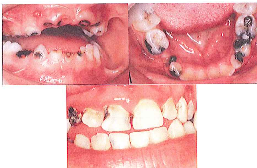
Figura 6 – Cáries dentárias extensas existentes em dentição decídua e mista (Color Atlas of Oral Diseases in children and adolescents, 1994)

Muitas vezes, a primeira vez que a criança é levada ao consultório dentário, apresenta já um elevado número de cáries e outro tipo de problemas. É necessário distinguir se a falha em levar a criança a este serviço de saúde é intencional ou, pelo contrário, se deve a outros factores distintos como falta de conhecimento da importância da saúde oral ou falta de meios económicos. (Kellogg et al. , 2005)