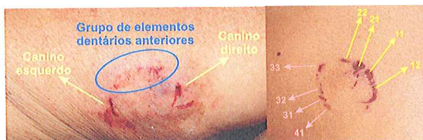
Figura 5 – Marcas de mordedura humana ( http://www.carvalho.odo.br )

A documentação fotográfica desta lesão deve obedecer a algumas regras, designadamente, deve ser colocada uma escala junto do traumatismo para avaliar as suas dimensões, a lente da máquina fotográfica deve estar numa posição paralela à lesão e deve incidir directamente sobre esta. (Kellogg et al. , 2005)