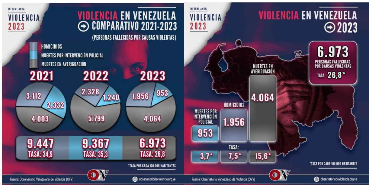
Figura 7. Informe Anual de Violencia 2023...

Un factor importante a tener en cuenta en relación a este país, es la tasa de mortalidad, la cual un significativo número de muertes violentas registradas en 2023 muestra una tasa de 26,8 muertes por cada 100 habitantes, el cual es un número alarmante, pero que a la vez supone una gran reducción en comparación con años pasados como 2021 y 2022. los cuales situaron la tasa en 34,9 y 35,3 fallecidos por cada cien mil habitantes(Observatorio Venezolano de Violencia, 2023).