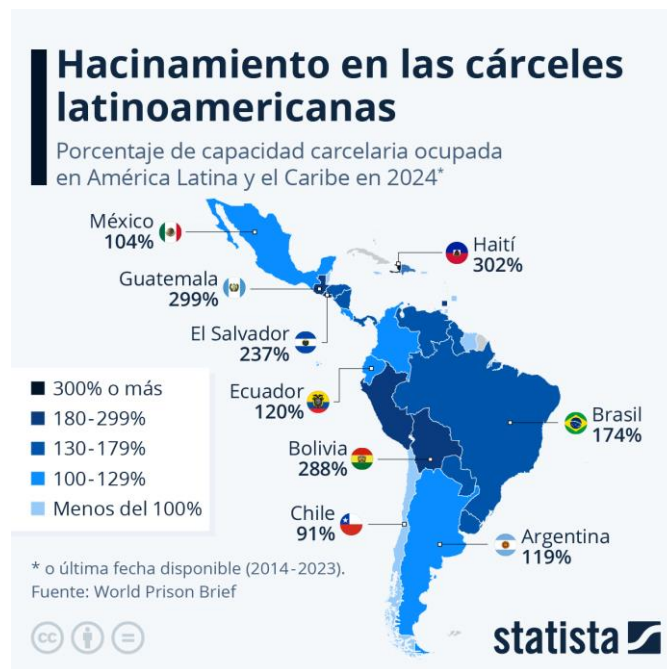
Figura 1. Hacinamiento carcelario...

https://es.statista.com/grafico/18213/porcentaje-de-capacidad-carcelaria-ocupada-en-america-latina/