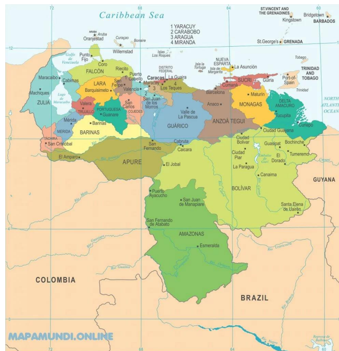
Figura 6. Mapa da Venezuela ...

Venezuela es un país que presenta una población estimada de 33.800 millones de habitantes según cifras obtenidas en el año 2023(INE, 2024), el cual se encuentra situado en el continente americano, específicamente en el norte de América del sur, donde limita al norte con el mar caribe, al sur con Brasil, al este con Guyana y el océano Atlántico, y al oeste con Colombia.