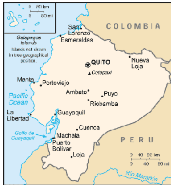
Figura 2. Geografía de Ecuador... Fuente: Santiago. 2008.

https://geografia.laguia2000.com/geografia-regional/americas/geografia-ecuador-generalidades