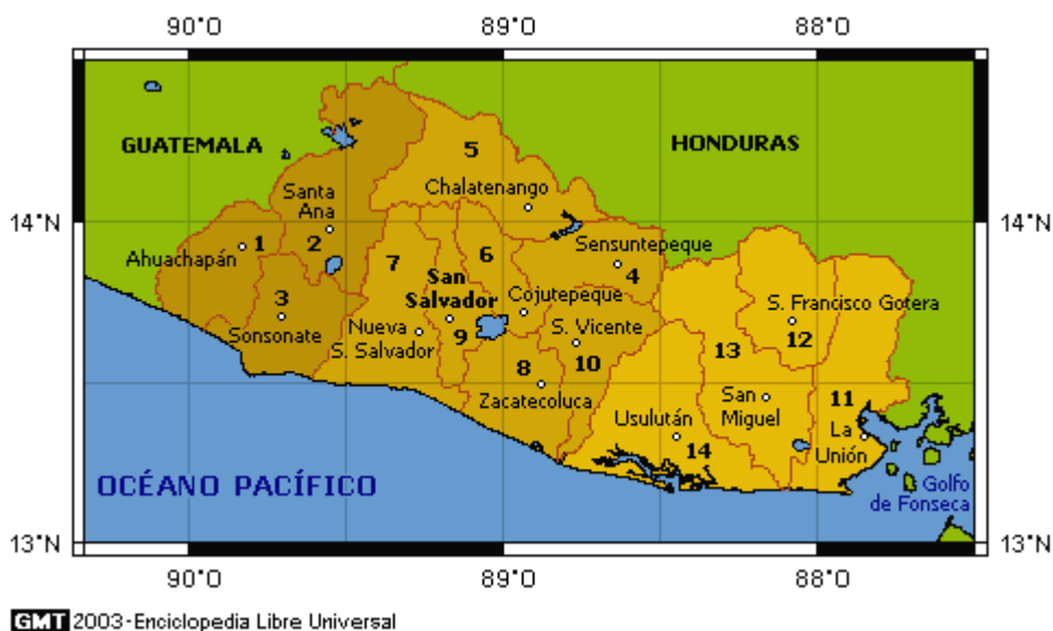
Figura 5. Geografía de El Salvador: generalidades...

El Salvador es un país que se encuentra situado en el continente americano, específicamente en la región de América Central, donde limita al norte y noroeste con Honduras, oeste con Guatemala, al sur con el océano Pacífico y al sureste con el Golfo de Fonseca que lo separa de Nicaragua (República de El Salvador, s.d.). La forma de gobierno es de una república presidencialista, siendo el jefe del Gobierno y el jefe de Estado la misma persona, donde el presidente tiene un periodo de cinco años y sin posibilidad de reelección (Santiago, 2008).