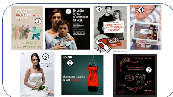
Figura 1: Campanhas Publicitárias

No que diz respeito à amostra, para realização deste estudo, foram selecionadas através de um processo de amostragem intencional sete campanhas elaboradas pela Comissão para a Cidadania e Igualdade e Género (CIG), pela Associação Portuguesa de Apoio à Vítima (APAV), pela Guarda Nacional Republicana (GNR) e pela empresa FOX, atualmente pertencente à Disney. As instituições foram devidamente contactadas e autorizaram a análise das imagens, que estão dispostas abaixo.