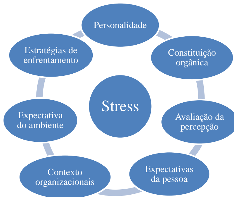
Figura 1 Fatores que determinam o estresse