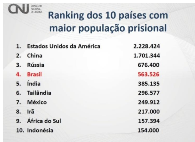
Gráfico 2: Ranking Mundial de Presos Efetivamente mais presos domiciliares – 2014