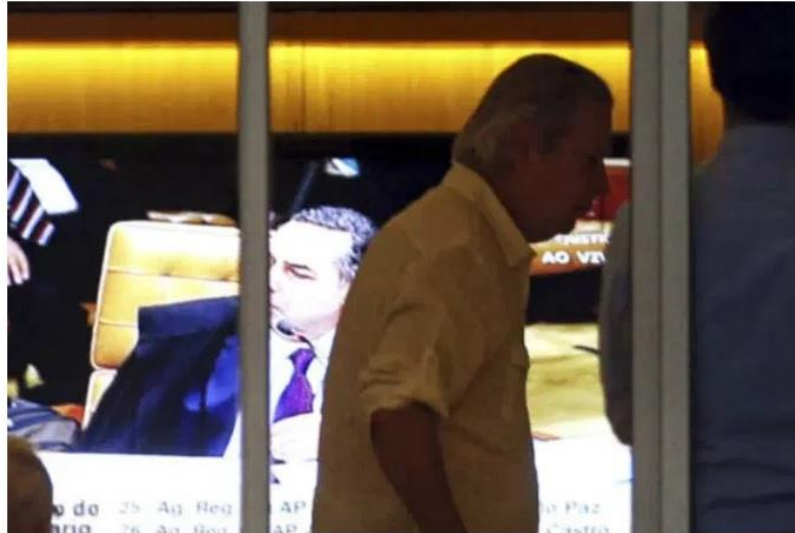
José Dirceu: o advogado de Dirceu dará uma entrevista em Brasília assim que houver uma definição sobre a aceitação ou não dos embargos infringentes

Anexo 5: Exame criticou a invasão de privacidade promovida pela Folha , mas promoveu outra invasão de privacidade, idêntica, para ilustrar sua matéria.