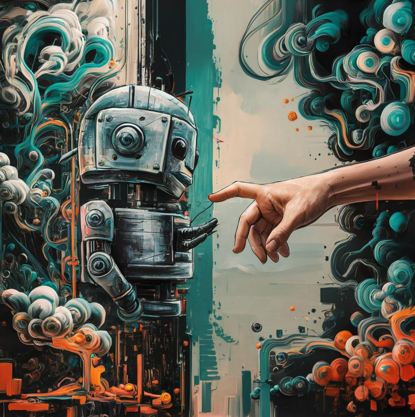
imagem criada com recurso a um modelo de IA, propõe representar a relação entre o robot e o ser humano

significando uma relação de toque divino entre o ser humano e as suas construções