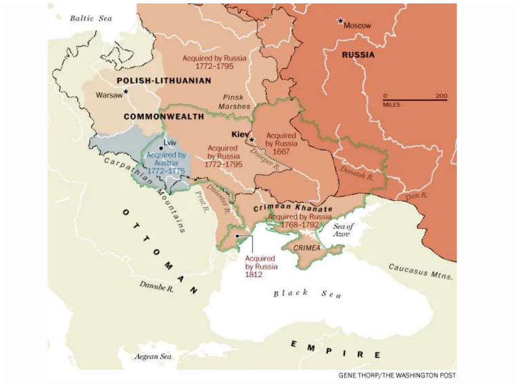
Mapa 3 – Divisão do território da Ucrânia, século XVII.

Nos séculos XVII e XVIII, vemos que o território que é atualmente a Ucrânia se encontrava à margem de impérios concorrentes. Era uma região de permanente disputa e de fronteiras voláteis. A Comunidade Polaco-Lituana - que, no seu auge, abrangia uma enorme faixa da Europa - dominou grande parte do território, mas a Ucrânia também assistiu às incursões de húngaros, otomanos, suecos, bandos de cossacos e exércitos de sucessivos czares russos.