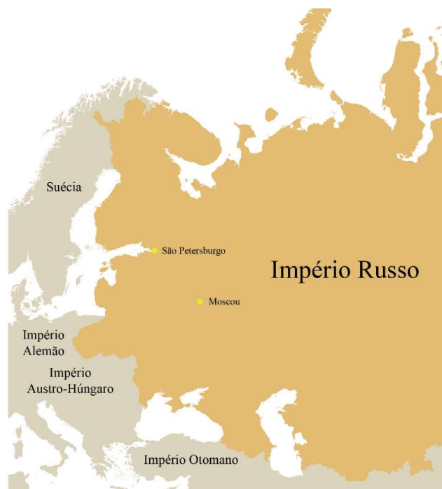
Mapa 5 - Antigo Império Russo

discurso de Putin na justificativa de que a ação tomada pelos russos se tratava de um movimento de integração da região, tal qual como houve no caso da guerra da Crimeia. Sabe-se que o presidente Vladimir Putin deseja reconstruir o grande império russo que há muito se encontra desagregado, o desejo imperialista de Putin começaria pela Ucrânia e acabaria por circundar os países que envolvem o resto do mapa do leste europeu, este desejo de expandir o seu território retrata o mesmo desejo imperialista de Adolf Hitler (1889-1945) quando começou a sua campanha expansionista de modo a conquistar os territórios vizinhos da Alemanha Nazi (Lebelem, 2022).