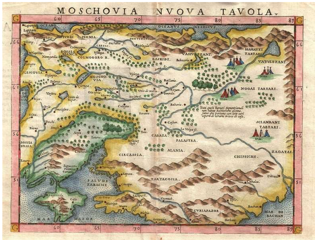
Mapa 2 - Mapa de Girolamo Ruscelli mostra Rússia e Ucrânia em 1574.

A capital do principado, Kiev, assumiu a preponderância como centro de comércio entre o Mar Negro e o Mar Báltico. Durante este período histórico, a cultura “Kievan Rus” também avançou, com realizações notáveis na arquitetura, pintura e literatura, fomentando uma identidade cultural da comunidade política que, posteriormente, não lhe sobreviveu. No século XIII, como resultante da desintegração do principado e da invasão mongol, o “Rus de Kiev” começa a declinar. A queda dos “Rus de Kiev” marcou o início de um período de divisão e luta na história Rússia-Ucrânia, que não voltaria até o czarismo russo (Ramos, Lima, Neto, 2022).