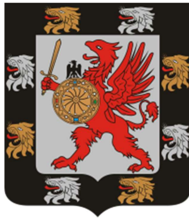
Fig. 1 – O brasão de armas dos Romanov.

A chegada do Czar Pedro, o Grande, em 1682, marcou o início do czarismo russo. Pedro reorganizou o exército e a marinha, construiu uma nova capital a que denominou de São Petersburgo e modernizou a nação para torná-la uma potência europeia. A Rússia também se expandiu para o leste sob o seu governo, anexando a Sibéria e o Cáucaso (Hosking, 2012).