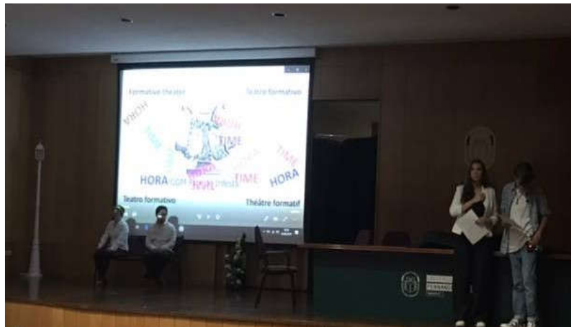
FIGURA 6 – HORA

Foi apresentado o exercício dramático “Hora”, no I Congresso de Ação Humanitária, Cooperação e Desenvolvimento, na UFP