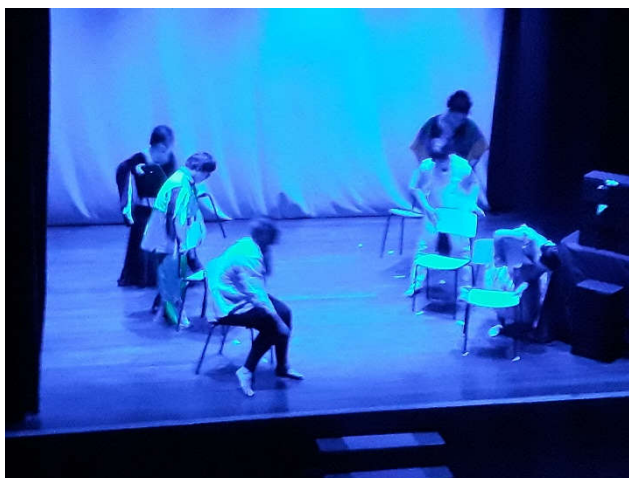
FIGURA 4 - PÁSSARO DA ALMA

Sendo apresentado integralmente no auditório do Grupo Dramático e Musical Flor de Infesta em 2 agosto 2019.