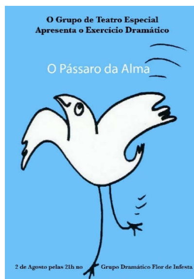
FIGURA 5 – PÁSSARO DA ALMA (CARTAZ)

No fundo, lá bem no fundo do nosso corpo.