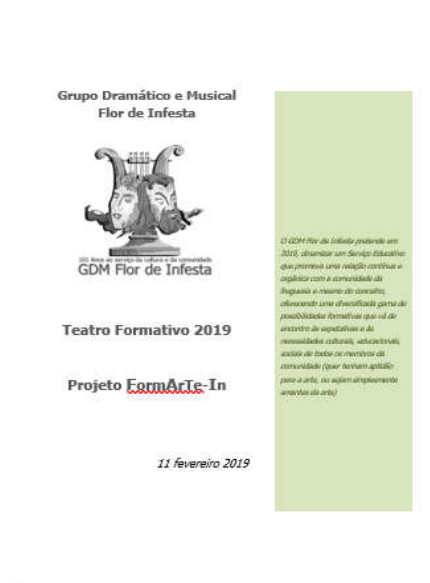
FIGURA 2 – PROJETO FORMARTE - IN

Sendo que o grau e tipo de deficiência será avaliada com a escola e ter-se-á sempre em consideração a maior ou menor homogeneidade do(s) grupo(s).