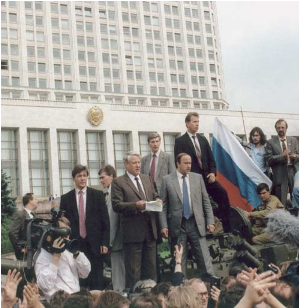
Ilustração 13 Boris Ieltsin no meio do povo aquando do Golpe de Estado (Gosset e Fédorovski , 1991, p 135)

“Vrémia”, imagens de Boris Ieltsin confraternizando com os tripulantes dos carros de combate? Como entender a sua total liberdade de deslocação e de expressão, enquanto ele apela à greve geral em prol de Mikhail Gorbatchev, mesmo contrariando a proibição do Comité em relação à greve. É espantoso os Putschistas terem deixado o seu opositor falar de uma forma livre na televisão correndo o risco de este último sair com uma imagem de herói democrata.