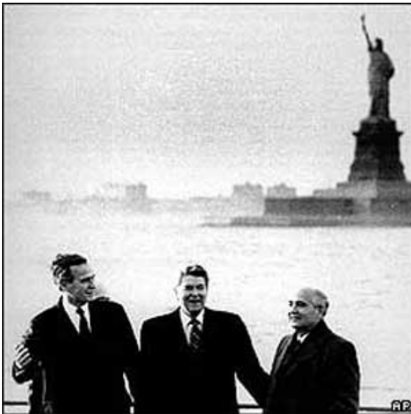
Ilustração 9 Encontro de Georges Bush, Ronald Reagan e Gorbachev nos USA

O primeiro contacto da URSS com o Ocidente durante o consulado de Gorbachev teve lugar em Genebra, em Janeiro de 1985, entre Shultz e Gromiko. No entanto, o Ocidente ainda desconfiado age com prudência e grandes reticências. Mitterand toma a iniciativa seguinte e convida Gorbachev a visitar oficialmente Paris. Ainda no mesmo ano realiza-se em Genebra a primeira cimeira Reagan/Gorbachev; nesta conferência reconhece-se que a guerra nuclear só poderá trazer malefícios para a sociedade. Foram estabelecidos contactos diplomáticos com organizações internacionais nomeadamente com a ONU. O poder nuclear constituía um entrave ao desenvolvimento económico, sendo deste modo necessário iniciar um esforço de desarmamento e de desmilitarização. Gorbachev colocava em segundo plano a corrida ao armamento.