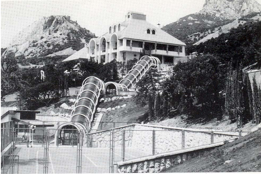
La datcha de Gorbatchev, à Fors, sur les bords de la mer Noire.

mesmos pela periferia. Gorbachev estava convencido que a maioria das Repúblicas ficaria na União. Uma União onde seria possível desfrutar de uma verdadeira independência.