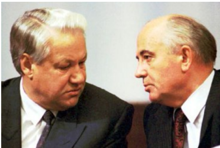
Ilustração 10 Boris Ieltsi e Gorbachev

Boris Ieltsin surge como principal opositor de Gorbachev. Ele defendia a manutenção do rigor na luta contra a corrupção e contra os privilégios da Nomenklatura. Com um relacionamento íntimo com as massas russas, este homem de tendências reformistas, formado em engenharia, esperou até aos trinta anos para ingressar no PCUS e em 1985 ascendeu à posição de primeiro secretário do Comité Central do Partido da cidade de Moscovo. A sua ascensão foi rápida, cedo começou a destabilizar o Politburo, com discursos exaltados para a irradicação das injustiças sociais. Ele reclamava o fim da centralização e a