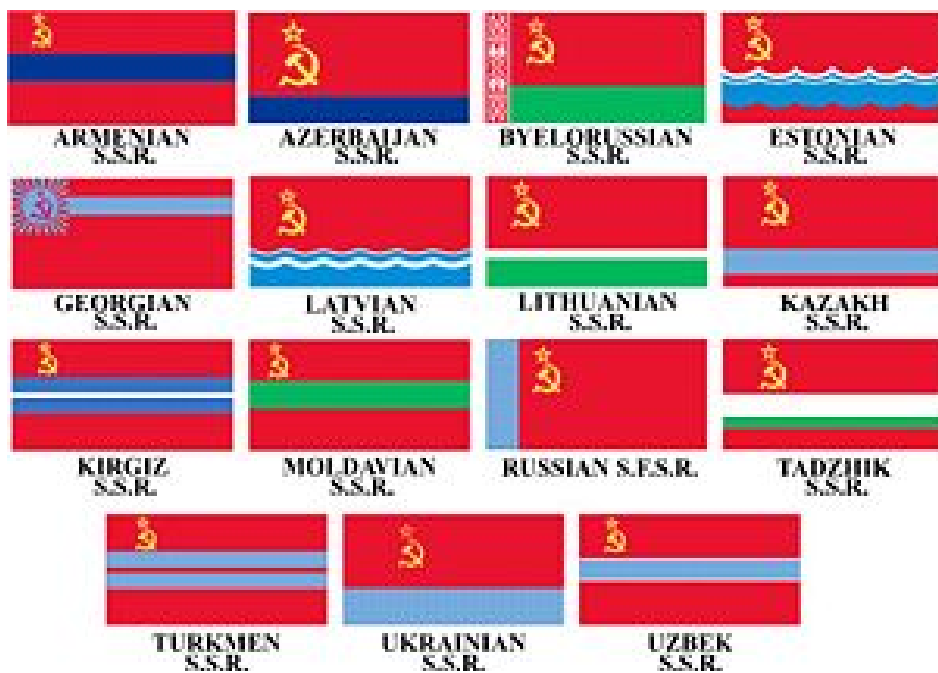
Ilustração 4, Bandeiras das quinze Repúblicas que formam a URSS

É o mais populoso estado muçulmano, possui terras férteis e reservas maciças de gás natural que permitem assegurar as suas necessidades energéticas. Por volta dos anos 90, os solos encontram-se esgotados devido a monocultura do algodão. O crescimento demográfico provoca desemprego e a pobreza acentua-se.