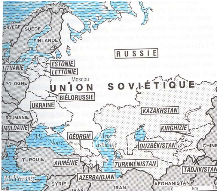
Ilustração 1 ( Mapa da URSS, AA.VV, 1989, p 61)

A URSS era o maior país do mundo com 22.400.000 de km 2 , estendendo-se desde o Báltico e o Mar Negro até ao Oceano Pacífico, quase tocando a América do Norte. O seu território tinha 60.000 km de fronteiras terrestres, ligado a 12 países tendo assim a oeste: